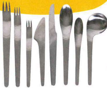
「ナイフ、フォーク、スプーン、茶匙」 1951年 ユー・ホルム 個人蔵