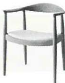
ハンス・ヴィーイナ「椅子 pp503 (ラウンドチェア/ザ・チェア)」 1950年 PPモブラー

会場にはハンス・ヴィーイナの椅子5脚に座れるコーナーも! ケネディ大統領も座った名作(ザ・チェア)の座り心地をぜひお試しください。※要観覧券