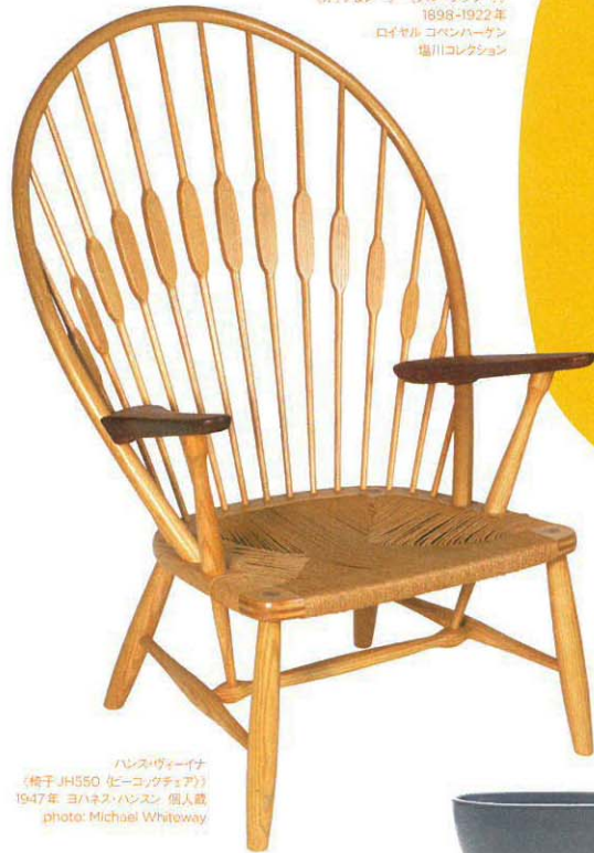
ハンス・ヴィーイナ 「椅子 JH550 (ビー・コングチェア)」 1947年 ヨハネス・ハンスン 個人蔵