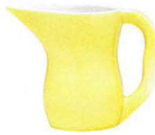
ウアスラ・モンク・ピーダスン (食器セット(ウアスラ)) 1991年 ケーラーデザイン デンマーク・デザイン博物館