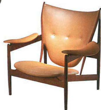
フィン・ユール 「椅子(チーフチェア)」 1949年 エルース・ロート・アナスン デンマーク・デザイン博物館