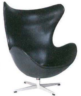
アーネ・ヤコブソン 「椅子(エッグチェア)」 1958年 [1965年頃] フリッツ・ハンセン 個人蔵