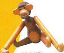
カイ・ボイブセン 「玩具(サル)」 1951年 個人蔵