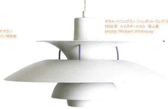
ボウル・ペニンダスン (ペンダント・ランプ(PH5)) 1958年 ルイス・ボールセン 個人蔵